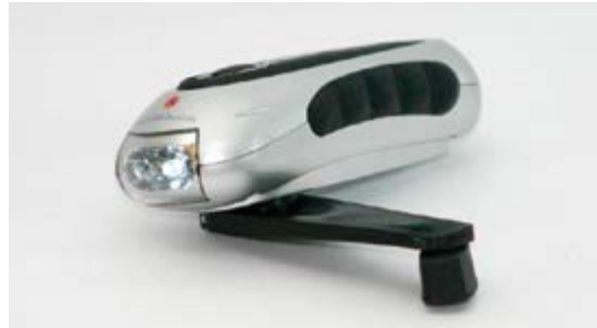
Eine Taschenlampe mit Handkurbel kann bei Stromausfall hilfreich sein.