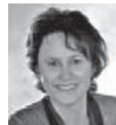
Ambulante Krankenpflege in häuslicher Umgebung nach Ihren persönlichen Wünschen - seit über 28 Jahren.