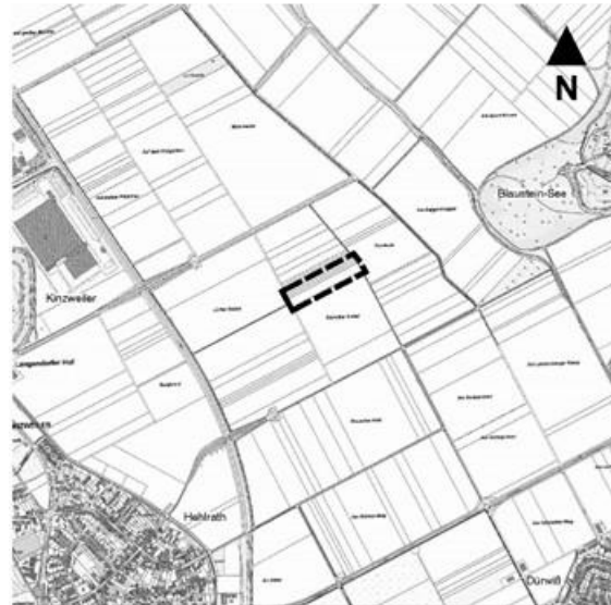
Auszug aus der ABK. Dieser Plan ist urheberrechtlich geschützt.

gemäß § 3 Abs. 2 des Baugesetzbuches (BauGB) in der derzeit gültigen Fassung in Verbindung mit § 4 der Satzung über die Bürgerbeteiligung der Stadt Eschweiler mit dem im nachstehend abgedruckten Kartenausschnitt dargestellten Geltungsbereich beschlossen.