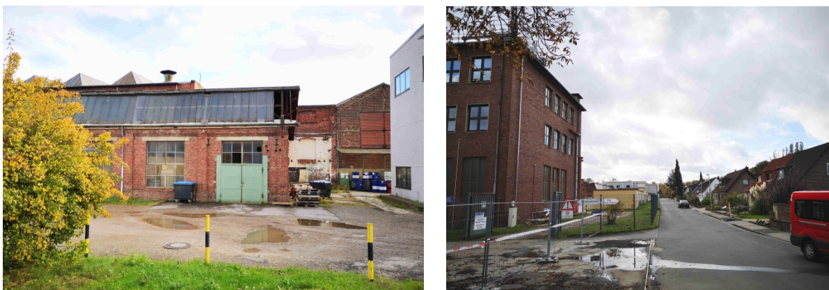
Abb. 3+4: Impressionen vom Werksgelände und der vorhandenen Wohnbebauung

Eine städtebaulich problematische Entwicklung durch Entstehung brachfallender Gebäudeteile und minderwertiger Nutzung soll durch die Aufstellung des Bebauungsplanes 307 – Altstandort ESW Röhrenwerke - verhindert werden. Um das Entwicklungspotential der Fläche nicht einzuschränken, sollte die Erhaltung der Gebäude im Bebauungsplanverfahren nicht im Vordergrund stehen.