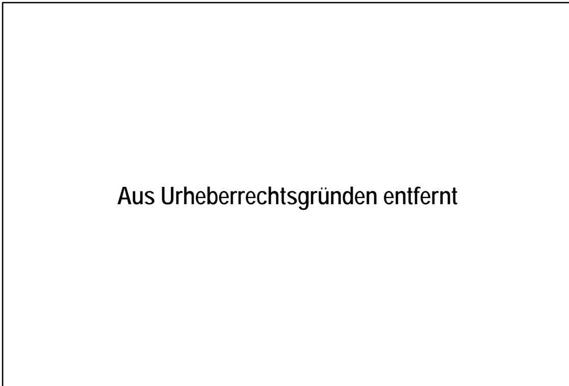
Abb. 2: Luftbildperspektive aus Richtung Süden mit Darstellung des Geltungsbereichs

Im Nordwesten schließt der Geltungsbereich an die Wohnhäuser der Auestraße an. Im Nordosten bindet der Geltungsbereich die dem Betrieb zugehörigen Parkflächen mit ein. Im Südosten bilden die Bahnanlagen die Abgrenzung. Im Südwesten bildet der erhaltenswerte Bereich des Landschaftsschutzgebiets mit dem Hundedressurplatz die Abgrenzung. Somit umfasst der Geltungsbereich in seinen Grundzügen die im Flächennutzungsplan als „Gewerbliche Baufläche (G)“ dargestellte Fläche.