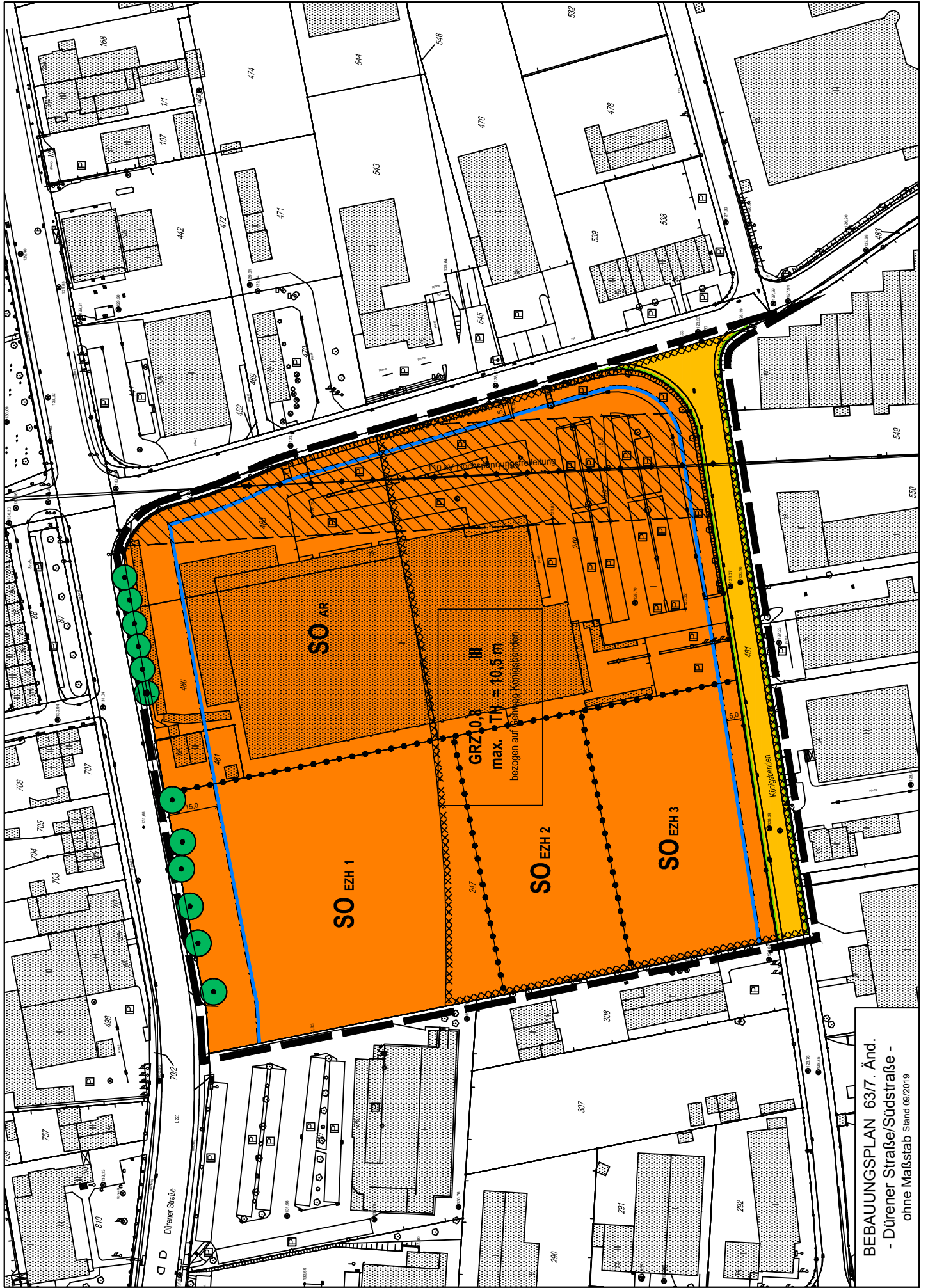
BEBAUUNGSPLAN 63/7. Änd. - Dürener Straße/Südstraße - ohne Maßstab Stand 09/2019