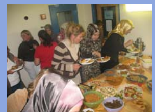
Interessengemeinschaft Frauen und Mädchen

Ziel: Strukturen schaffen, die langfristig dazu führen, dass: • Wohn- und Lebensverhältnisse im Stadtteil verbessert werden • mehr Verteilungsgerechtigkeit entsteht • mehr Demokratie vor Ort gelebt wird • das Zusammenleben verbessert wird • Ansprechpartner/innen vor Ort vorhanden sind, um Kommunikation untereinander und mit Stadt und Verwaltung zu fördern