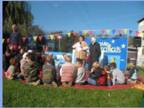
Interessengemeinschaft Weser-, Ost- Maasstraße