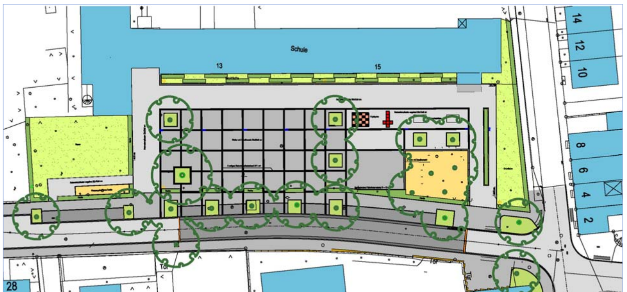
Entwurf in Zusammenarbeit mit den Bewohnern, Vereinen und Institutionen im Stadtteil.