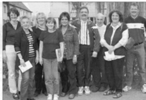
Kommern sich mit mehr als einem Jahr um die Belange der Bewohner der Bergmannssiedlung in Eschweiler-Ost... Die AG Denkmalschutz, Straßen- und Kanalerneuerung, Parkplätze, die AG Miteinander Leben, die AG Mieter und die AG Siedlerfest sind die Säulen der Interessengemeinschaft.

Es war ein Jahr, das viele Themen brachte. In der Siedlung Eschweiler-Ost sind viele Menschen aktiv. Sie kümmern sich um die Belange der Bewohner. Die AG Denkmalschutz, Straßen- und Kanalerneuerung, Parkplätze, die AG Miteinander Leben, die AG Mieter und die AG Siedlerfest sind die Säulen der Interessengemeinschaft. Sie arbeiten daran, die Lebensqualität in der Siedlung zu verbessern. Die Bewohner sind stolz auf ihre Siedlung und wollen sie weiterentwickeln. Die Interessengemeinschaft ist der Motor dafür.