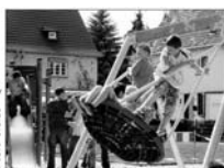
Nach der Inauguration von Ost und Ost Ost in Eschweiler-Ost ist die Siedlung ein Schmuckstück... Die Siedlung Eschweiler-Ost ist ein Schmuckstück. Sie ist ein Ort, an dem die Bergleute ihre Heimat gefunden haben.

Die Siedlung Eschweiler-Ost ist ein Schmuckstück. Sie ist ein Ort, an dem die Bergleute ihre Heimat gefunden haben. Die Siedlung ist ein Ort, an dem die Bergleute ihre Heimat gefunden haben. Die Siedlung ist ein Ort, an dem die Bergleute ihre Heimat gefunden haben.